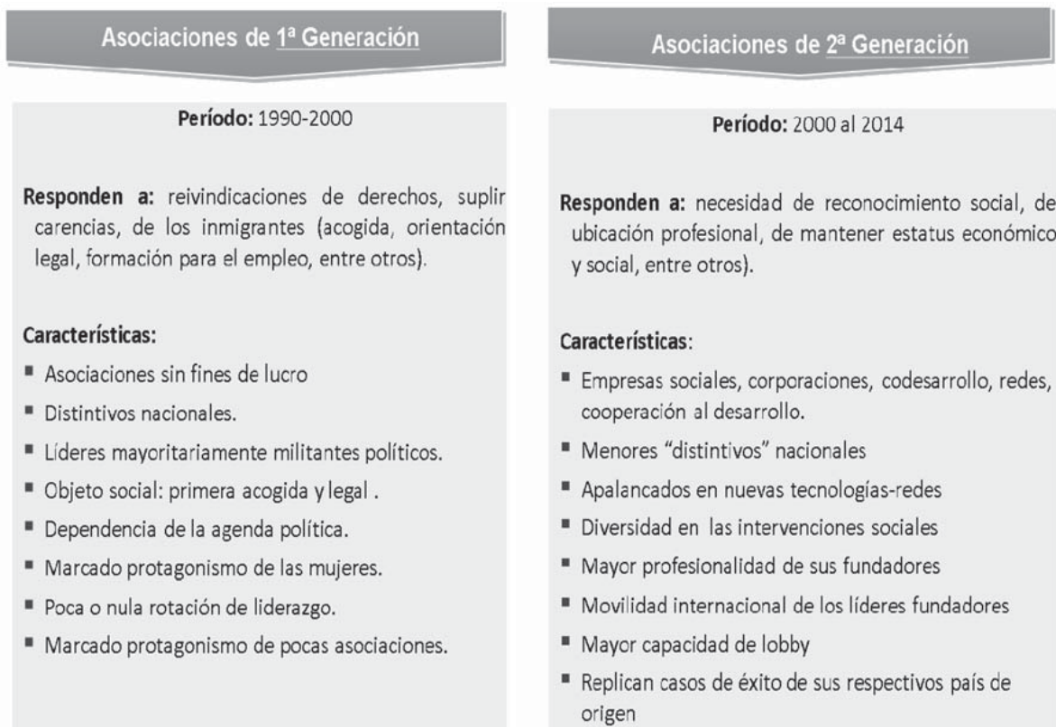
Figura 2. Características de las iniciativas sociales creadas por los inmigrantes latinoamericanos en la Comunidad de Madrid